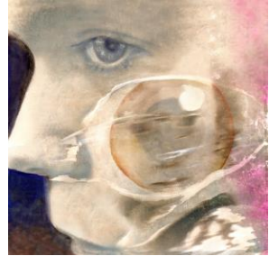
Plakat: Agder Nye Teater

Hvordan jobber man fra bok til scene? Hva er blitt løftet opp fra Torborg Nedreaas skjellsettende debutroman og hva er omtolket?